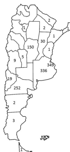
Proveedores por provincia