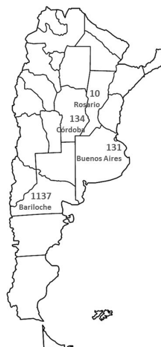
Localización del equipo

Remuneración y nivel laboral: Fijamos la remuneración de un ingresante a partir de una tabla de doce niveles laborales según la experiencia, los conocimientos acreditados y la complejidad de la función asignada. Esta clasificación no es un escalafón y el avance de cada persona se da acorde a su desempeño, la experiencia ganada y las responsabilidades asignadas.